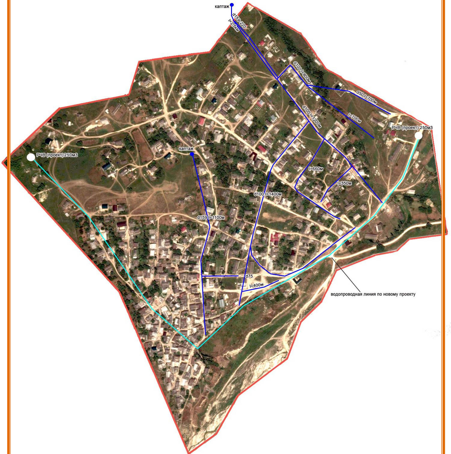
Схема водопроводных сетей в селе Кичи-Гамри