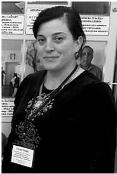
Аминатла назмурта Ахъбариб дарган багъа, Илала табтуртани Дунъя бициб гъанахла.